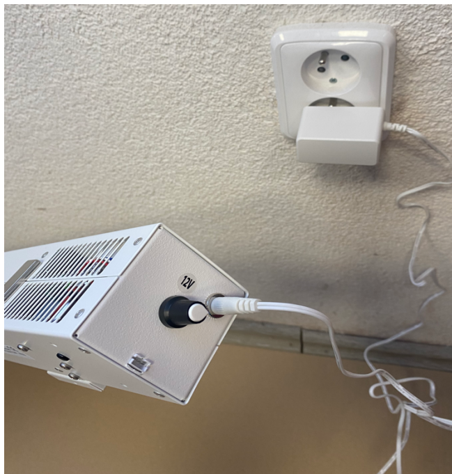
Obr.1 Zapojení adaptéru